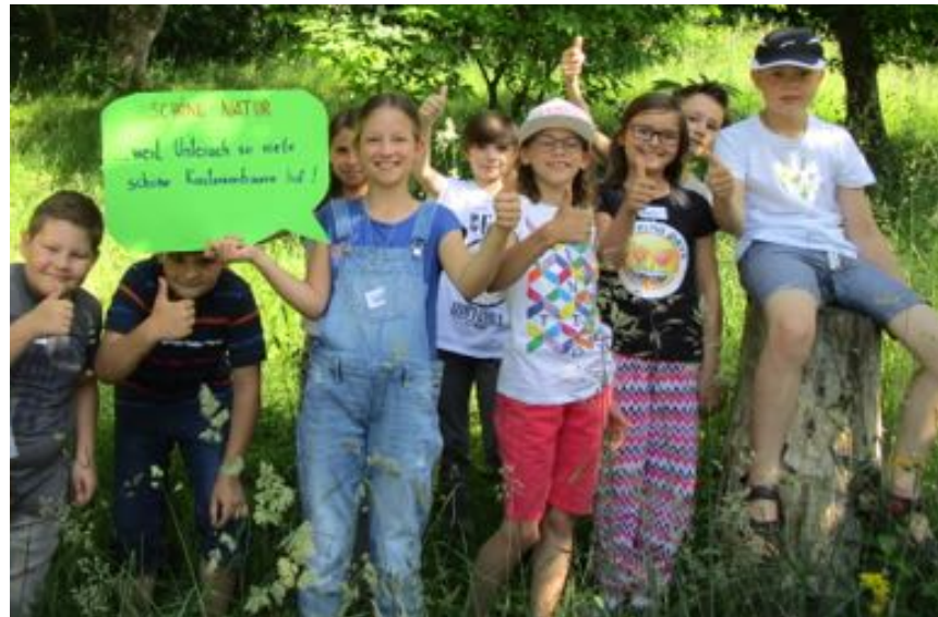
Wohlfühlorte für Kinder in Unterach: „Schöne Natur - weil Unterach so viele schöne Kastanienbäume hat“ (Projekt Kinder.Leben in Unterach, Juni 2018)