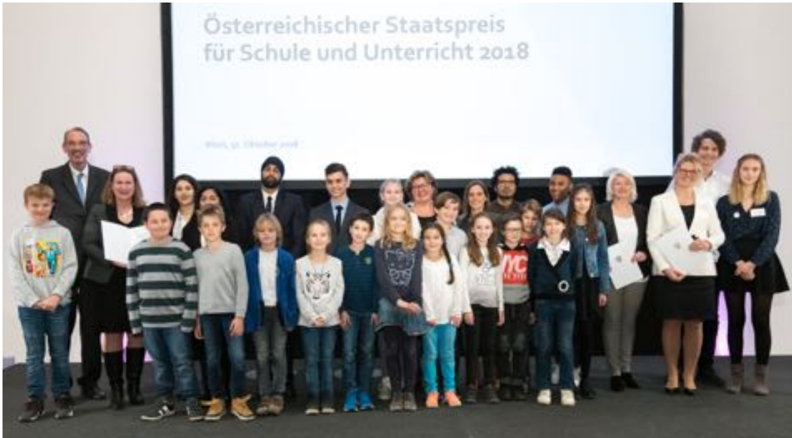
Preisverleihung am 31.10.2018 in der Aula der Wissenschaften in Wien

Mit dem Projekt „Kinder.Leben in Unterach“ wurde die UNESCO Volksschule Unterach am Attersee mit dem Sonderpreis für „Innovative Projektarbeit“ vom Bundesministerium für Bildung, Wissenschaft und Forschung ausgezeichnet.